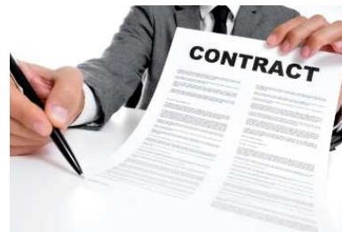
Per le prestazioni previste da contratto