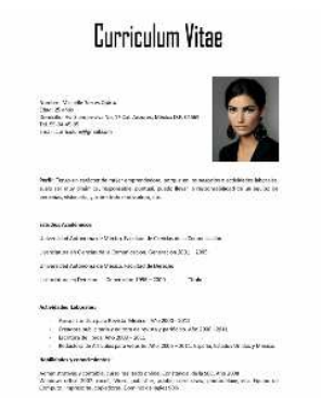
Per i curricula