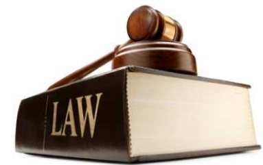
Per fare qualcosa obbligatorio per legge